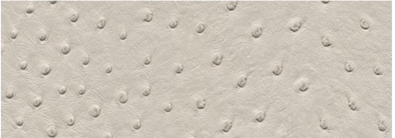
skai® Aliena perle F6321316

Un material skai® de alta calidad con estética de piel de avestruz de sensaciones naturales y un dibujo de grano delicado. Una creación excepcional dentro de las estéticas de piel más exclusivas.